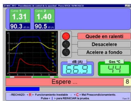
Sonometría y opacidad