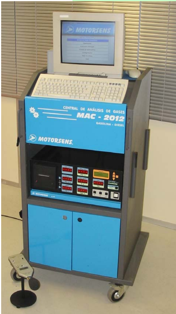
MAC-2012 con sonómetro y 4gases