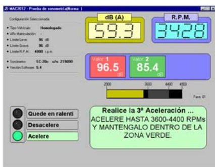
Prueba guiada de sonometría